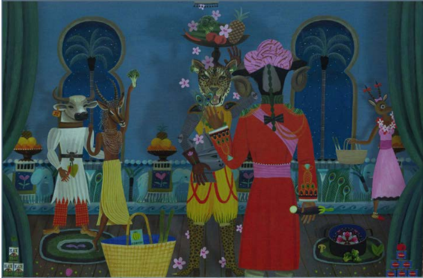
Fig. 4 : Le Fabuleux Amour d'Aucassin & Nicolette (Hinglais/Schamp 2010:[28]).