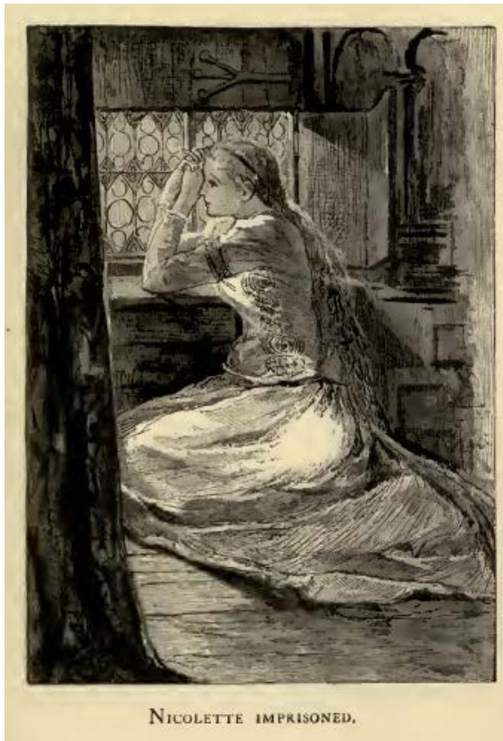
Fig. 2 : Nicolette enfermée, gravure de Mary Hallock Foote (1880:34).

le danois et le tchèque ; le castillan et l'italien affichent la mixité pour leurs deux traductions respectives. Les éditions-traductions féminines récentes semblent indiquer un rééquilibrage progressif, mais pour le moment, on constate que traduire Aucassin et Nicolette pour un public universitaire est une activité dans laquelle les hommes sont surreprésentés.