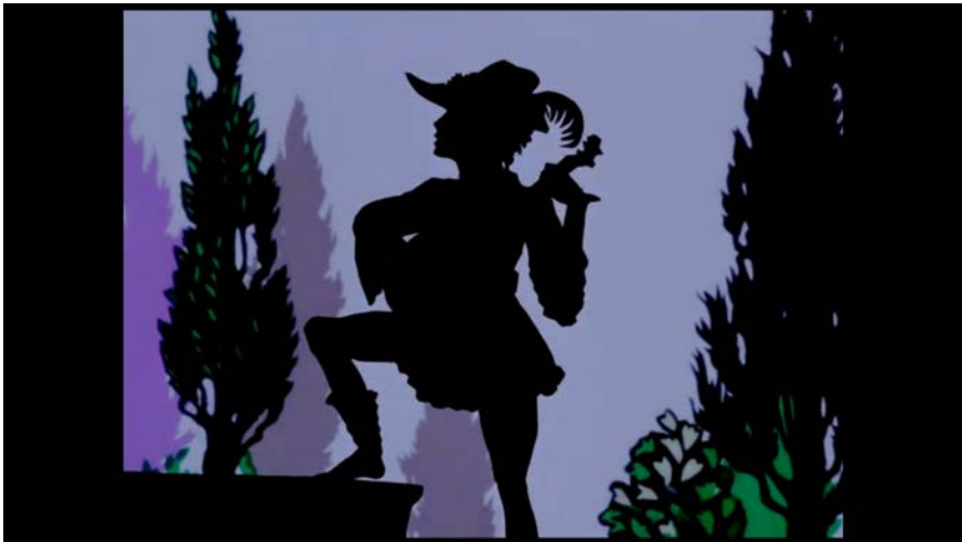
Fig. 3 : Nicolette en jongleur (Lotte Reiniger 1976). © Office national du film du Canada.

l'adaptatrice Ethel Mary Wilmot-Buxton, le roi de Torelore fait euphémiquement de la tapisserie au lieu d'accoucher (1910 ; ch.3), et la cinéaste allemande Lotte Reiniger applique son esthétique d'ombres chinoises à la chantefable en 1976. Cette production de la télévision canadienne élimine l'épisode de Torelore comme nombre de ses prédécesseurs. Dessinée dans un style néogothique proche du conte de fée, Nicolette y est très féminine : sa frêle figure se fait sagement brodeuse, et dans les scènes de couple, les représentations des genres sont conventionnelles. Si le charme de ce film d'animation est indéniable et la silhouette androgyne de Nicolette en jongleur (fig. 3) très réussie, les codes du genre social ne s'en trouvent guère ébranlés.