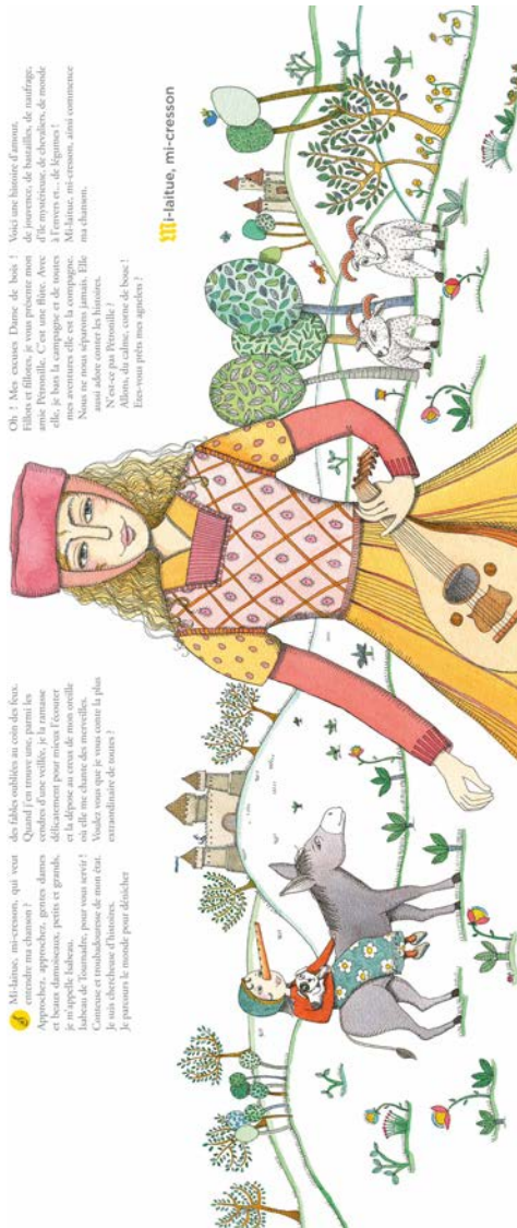
Fig. 5 : Une « conteuse et troubadousse » chantant Aucassin et Nicolette (Tamiato/Remires/Guiraud 2015:[4-5]).

héritière fidèle du jongleur Nicolette (fig. 5). Pure imagination, l'idée d'auteur ? Personne ne peut prouver le sexe ni le genre de l'anonyme à qui nous devons la chantefable à tous égards hors norme.